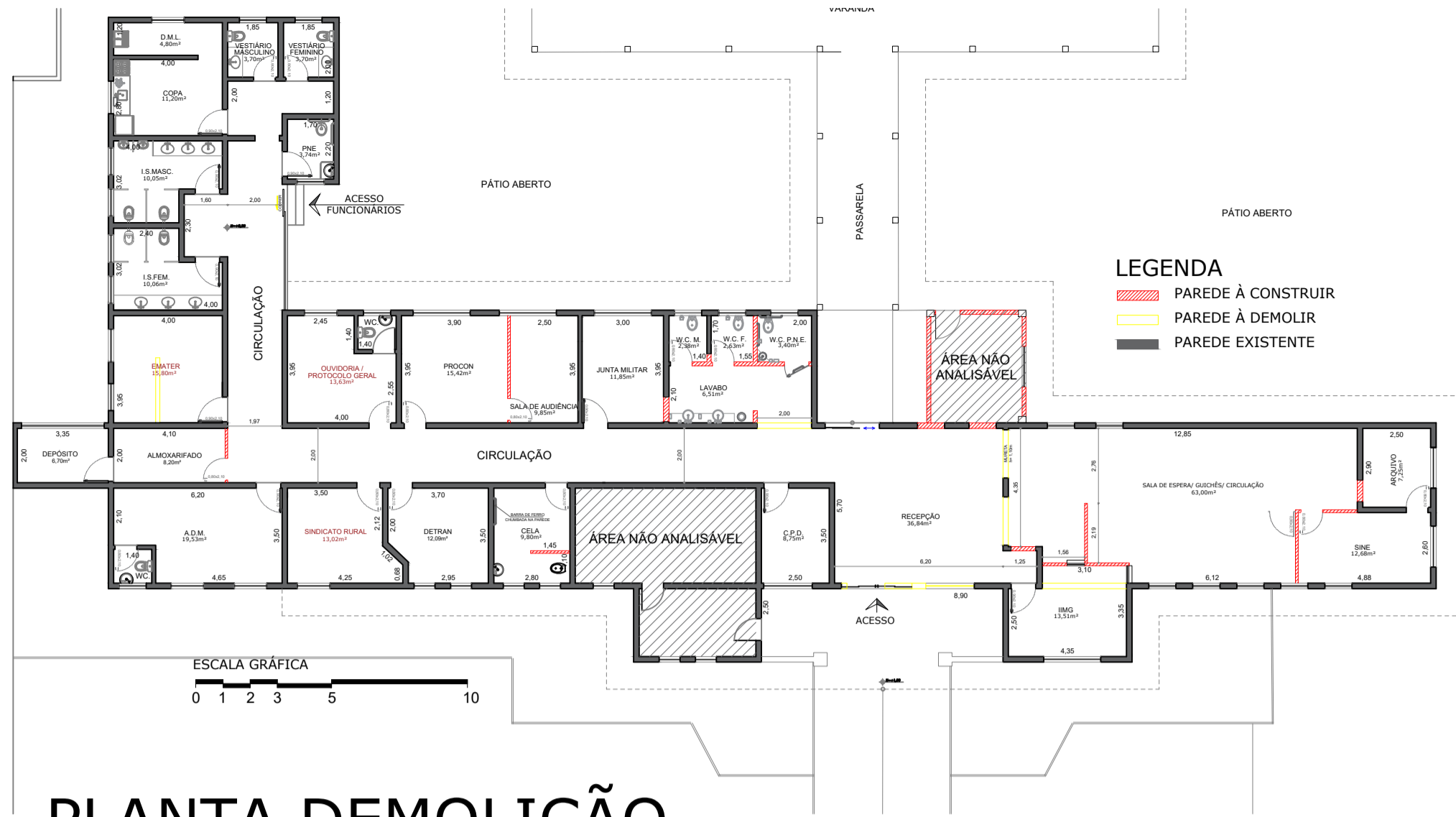
PLANTA DEMOLIÇÃO ESC.: 1/200